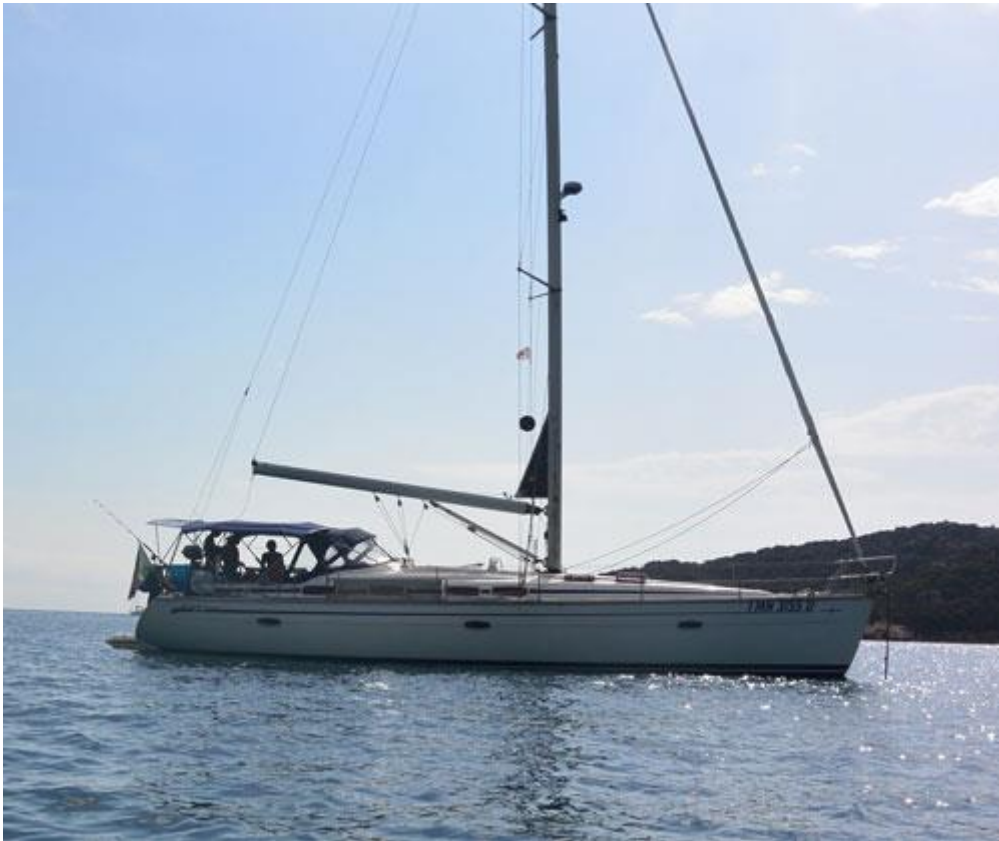
Bavaria 46 Cruiser