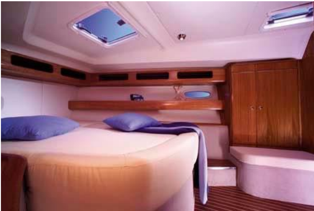
Cabina di poppa