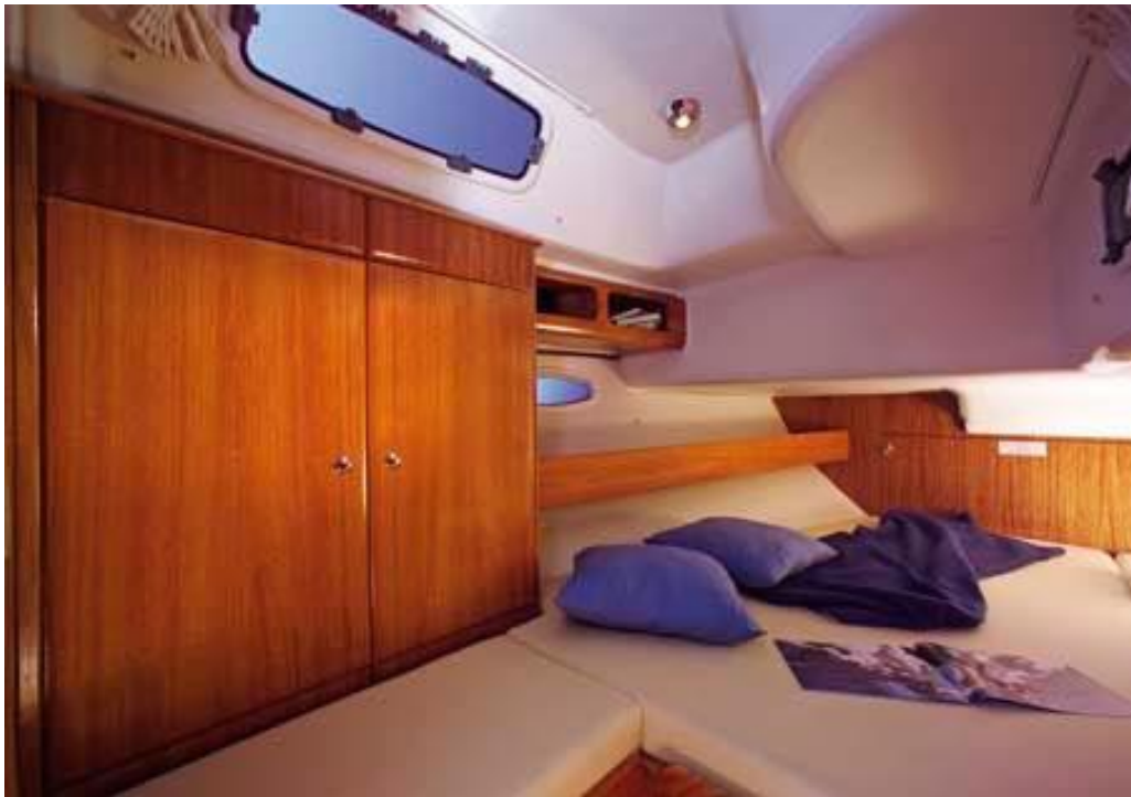
Cabina di prua