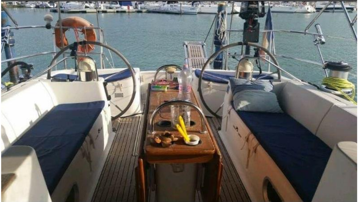
Pozzetto Sun Odyssey 52.2