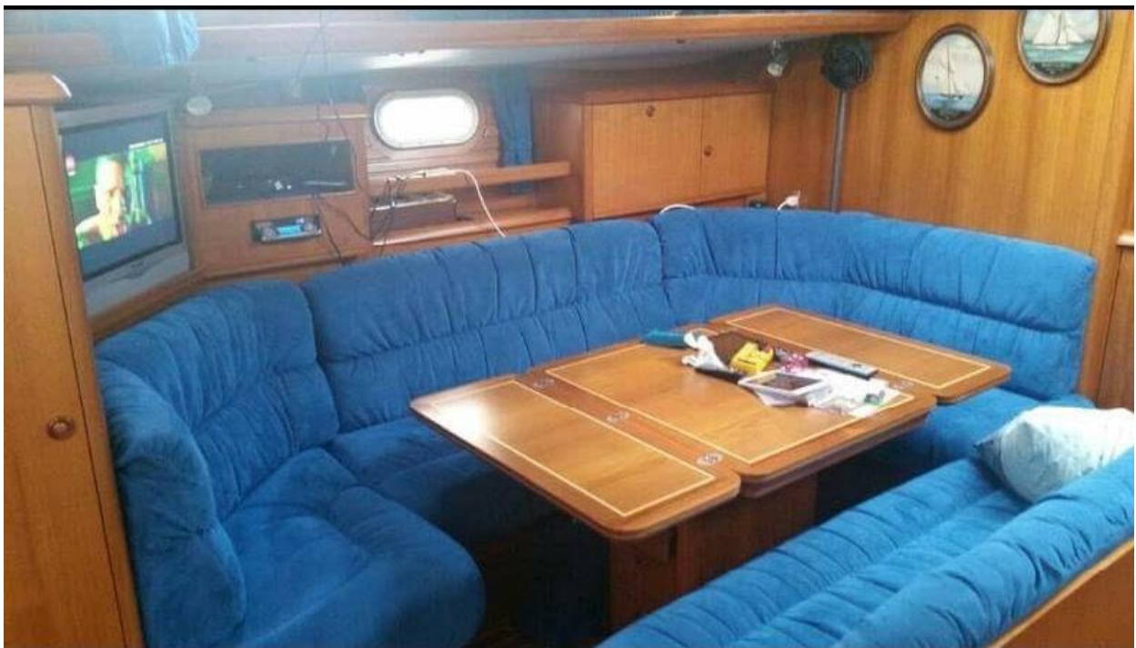
Tavolo e divani dinette